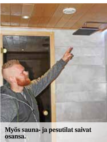
Myös sauna- ja pesutilat saivat osansa.

KEKKOLAN ALUE ON sijaintinsa puolesta myös mitä parhaiten kaikkien Kuokkalan palvelujen, Rantaraitin ja luonnon läheisyydessä. Seuraava näyttö on huomenna sunnuntaina 5.11. osoitteessa Muurarintie 1 C 15, klo 15.30–16.15. Kohdenro: 9533227