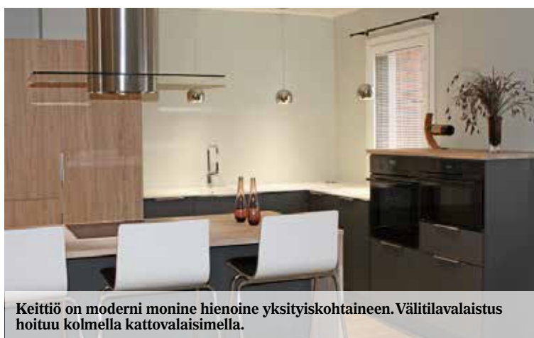
Keittiö on moderni monine hienoine yksityiskohtain. Väliovalaistus hoituu kolmella kattovalaisimella.